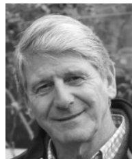
Beat und Team